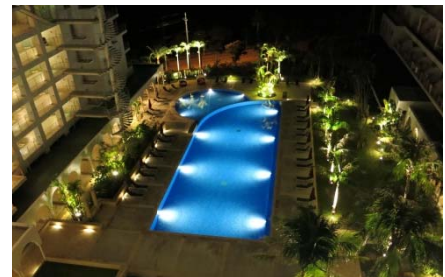
ホテルのプールへの設置例（沖縄）